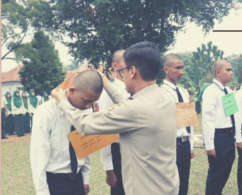
BINA FISIK & POLA ASUH ASRAMA

MABIDAMA (Masa Bimbingan Dasar Mahasiswa)