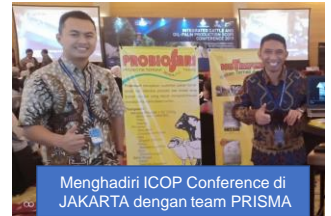
Menghadiri ICOP Conference di JAKARTA dengan team PRISMA