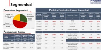
Kerjasama dengan Lembaga riset untuk menganalisa segmen pasar dalam persiapan penetrasi pasar untuk produk baru