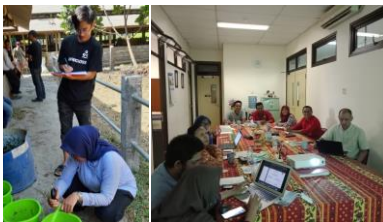
Kerjasama dengan Universitas dalam studi pengembangan produk baru untuk mengembangkan target segmen lain