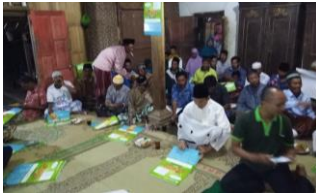
Demo Plot & Sosialisasi Pakan Sapi