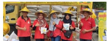
Kegiatan Market Storm dan One Day Promo di Pasar Hewan. Sponsor kegiatan Kontes Ternak