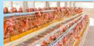
Usaha ayam petelur