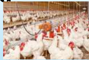
Usaha ayam pedaging