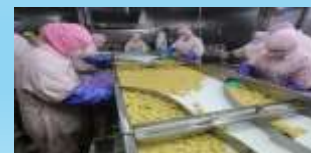
Industri pengolahan produk ayam