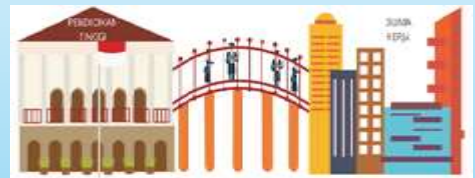
Menjembatani PT dengan stakeholders